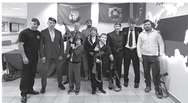
Команда «Боевого братства» проводит уроки мужества в школах Ленобласти

— Нам удалось собрать более 5 тыс. подарков. Это стало не просто региональной акцией, а все-