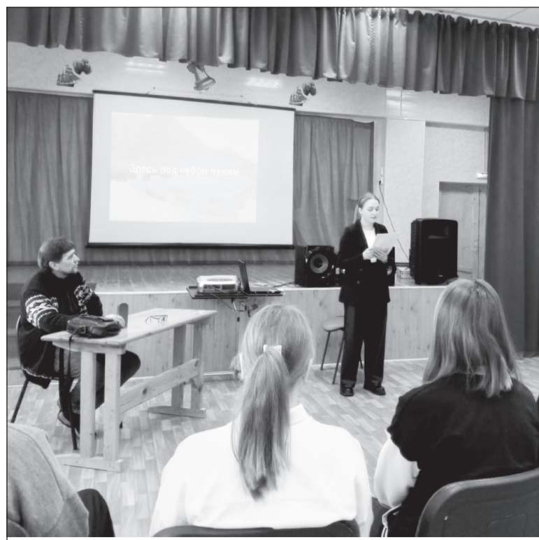
Круглый стол в Борской средней школе