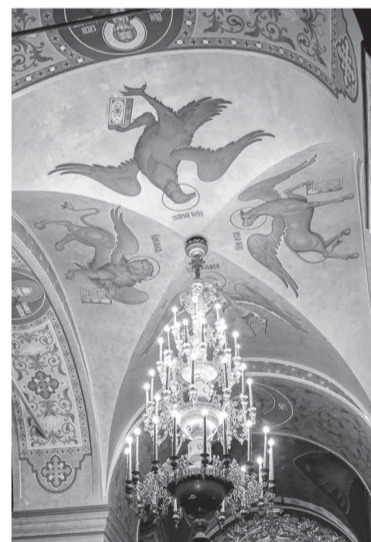
Внутреннее убранство одного из храмов монастыря

Но причём здесь Фиваида? Дело в том, что на заре утверждения христианства состоялся «великий исход» отшельников в египетскую пустыню, где постепенно сложилась своего рода зона расселения святых от-