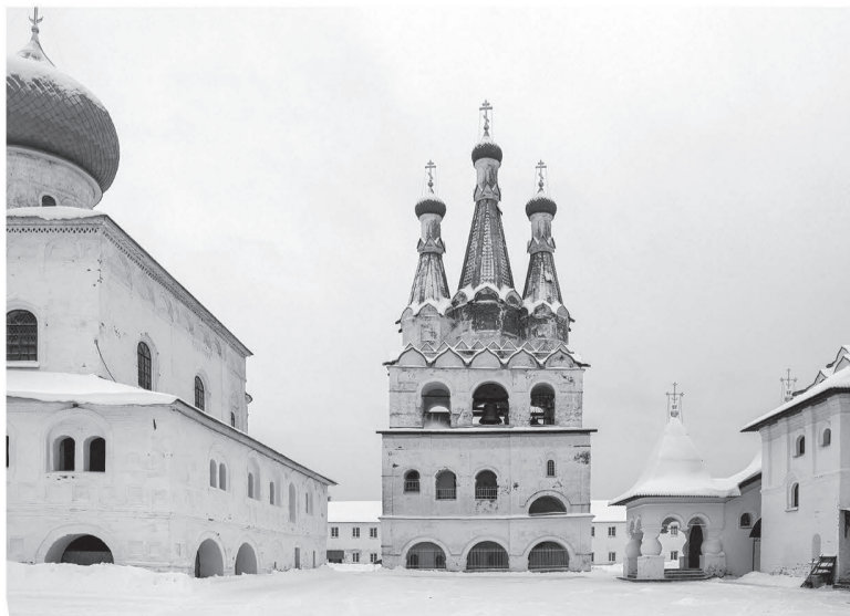
Александро-Свирский монастырь известен памятниками архитектуры XVI века