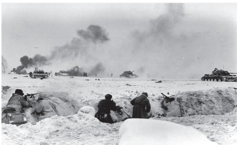
Бойцы Красной армии сдерживают натиск врага