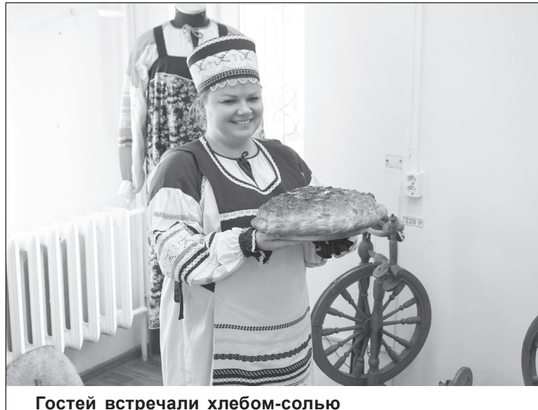
Гостей встречали хлебом-солью

С 19 января в фойе Дворца культуры будет работать передвижная документальная выставка Дома дружбы Ленинградской области «Архивы рас-