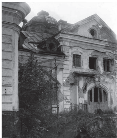
Историческая застройка Любани была уничтожена врагом