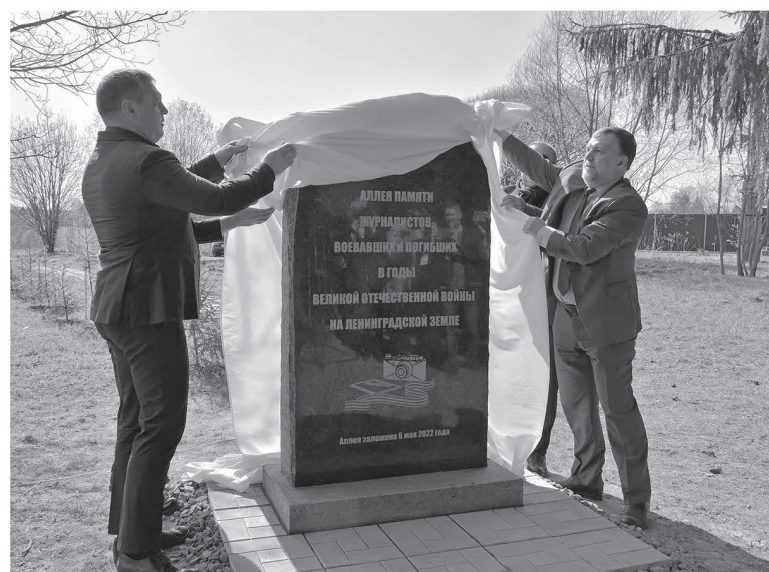
Открытие памятника военным журналистам, погибшим в годы войны

Сегодня Любань хранит память о подвиге Красной армии и страданиях мирных жителей. В городе расположены сразу несколько мемориалов, посвящённых событиям тех лет. В их числе — знаменитая «Берёзовая аллея» —