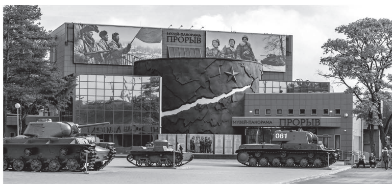
На 2024–2026 годы запланировано обновление музейного комплекса

Важно не забывать и про то, что Дорога жизни — это большое количество самых разных служб: ветеринары, дорожники, военная прокуратура, Ладожская военная флотилия, пограничники, аэросанные батальоны, буеристы, связные, которые доставляли донесения на мотоциклах... Хотелось бы рассказать посетителям музеев о работе этих служб, в том числе и в год 80-летия полного снятия блокады Ленинграда.