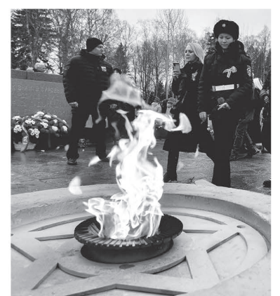
Годом ранее страна отмечала юбилей прорыва блокады

Командование союзных войск также восприняло эту победу